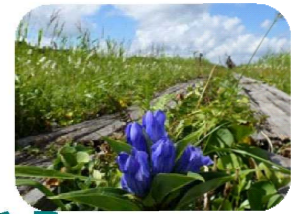
栗駒山産沼コース