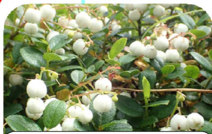
9月 シラタマノキの実