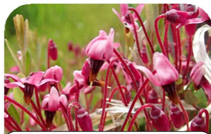
6月 ツルコケモモの花